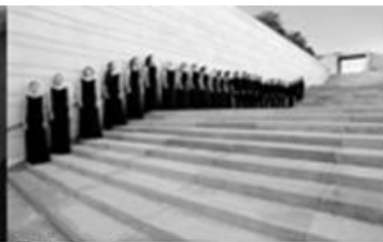
Estnischer Philharmonischer Kammerchor